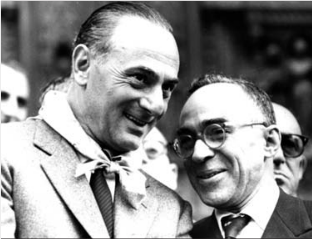
Enrico Mattei e Giorgio La Pira