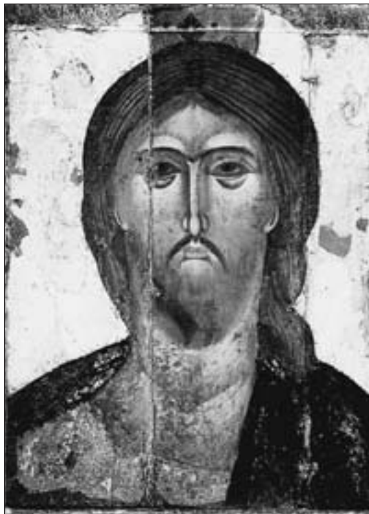
Mosca, Cremlino, Cattedrale della Dormizione, icona raffigurante Cristo Salvatore, sec. XIV.

Donaci di vivere in solidarietà profonda col nostro popolo per crescere, e patire, e lottare con esso, e rendere presente, dove Tu ci hai posto, la tua Parola di giudizio e di salvezza. Liberaci da ogni forma di amore universale e astratto, per credere all'umile e crocifisso amore, a questa terra, a questa gente. Amen. (Mons. Bruno Forte).