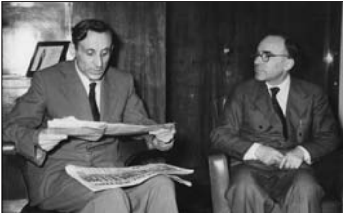
Giuseppe Dossetti e Giorgio La Pira

Ti raccomando i fanciulli abbandonati, la gioventù nello scandalo e nel pericolo, la vecchiaia nel bisogno, tutti coloro che soffrono nella povertà. Ti raccomando chi piange la morte dei suoi cari, chi cerca lavoro e non lo trova, chi soffre nella solitudine, gli ammalati, gli handicappati, le vittime della droga e dell'alcool, i carcerati, i deportati, coloro che sono in guerra, i profughi. Confortali Signore, aiutali, benedicili. Ti raccomando la nostra terra, ti raccomando il Papa, i vescovi, i sacerdoti, le suore, i missionari, le famiglie, i monaci. Ti raccomando, coloro che ancora non ti conoscono, e tutti quelli che sono lontani dalla chiesa. Forma Signore, un solo ovile con un solo pastore. (G. La Pira)