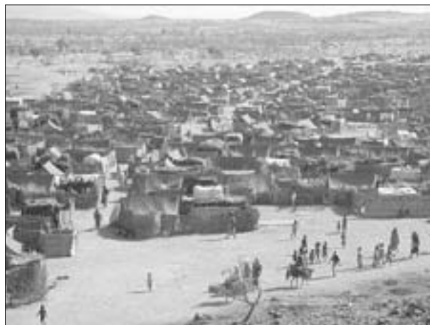
Uno dei primi campi per rifugiati sorti in Tchad a partire dal 2004

Nel Dar Fur e nel Dar Sila vi erano le stesse etnie: Fur , Dadjo , Quaddai , Zaghawa , Mahamas , Salhamat , Masalit e Mimis , alcune nomadi dedite alla pastorizia, altre stanziali dedite alla agricoltura. All'inizio del Novecento una grande carestia colpì la zona a sud ovest dell'E-