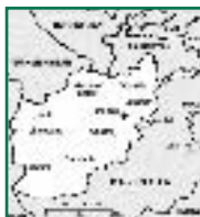
LA RICOSTRUZIONE AFGANA DALL'URSS A OGGI