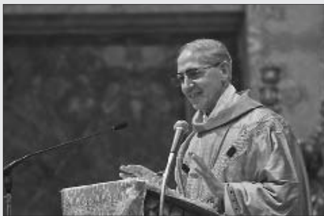
Adolfo Nicolas nuovo Generale dei Gesuiti

Pedro Arrupe. Nato nel 1936 a Palencia, in Spagna, si è laureato all'Università Gregoriana, nel 1971 ha conseguito un master in Teologia sacra ed è stato poi professore di Teologia Sistemica alla Sophia University di Tokyo. Dal 1978 al 1984 ha diretto l'Istituto Pastorale di Manila, nelle Filippine. Dal 1991 al 1993 è stato rettore dello Scolasticato di Tokyo, poi fino al 1999 ha assunto il ruolo di provinciale della Provincia dei Gesuiti del Giappone. Dal 2004 al