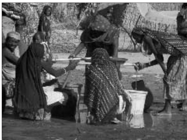
Donne al rifornimento dell'acqua

sentono gli asini ragliare. Bambini, ragazzi, giovani, adulti, tutti i maschi partono per la savana a dorso di asino. Torneranno alle loro capanne solo dodici ore dopo. Con loro portano l'immane brocca, che in passato era di rame ed ora è di plastica grezza, con la quale seguendo un preciso rituale fatto di equilibri (restano seduti sui talloni, su un solo piede), fanno le loro abluzioni rituali prima delle cinque preghiere. Hanno il viso coperto dal katamhu , una sorta di turbante da beduino che copre anche il volto: è il loro modo di ripararsi dal sole, dal freddo e soprattutto dalla polvere. La giornata scorre nei campi se gli uomini appartengono all'etnia Dadjo o Thama , oppure è dedicata alla pastorizia se appartengono ai Fuk . I Zaghawa hanno attività più elevate: appartenendo all'etnia presidenziale ed essendo storicamente nomadi mercanti, si occupano del commercio e seguono i mercati, e i mercanti della zona in cui sono collocati. Durante il giorno i siti degli sfollati sono popolati solo da bambini molto piccoli e donne. Le donne sono l'anima dei siti, il cuore pulsante. Il senso della famiglia e della storia dei po-