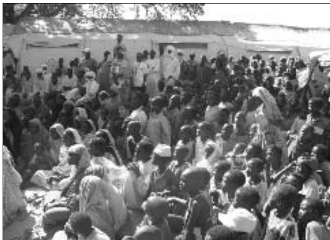
Assemblea del sito di Kubiku in occasione della giornata mondiale contro l'aids.

gitto. In cerca di pascoli e di cibo, scesero le tribù Baggara , nomadi pastori. L'arrivo di questa etnia ha portato disarmonia, l'origine araba dei Baggara era condivisa anche dagli Zaghawa . Un elemento importante differenzia gli Zaghawa dalle tribù africane: le donne Zaghawa non sono mutilate, non viene praticata loro la mutilazione della clitoride, l'altra particolarità (più un vanto formale che reale) era definita dall'essere molto osservanti della Sharja . Si dice che fossero un popolo di Marabù (i fedeli più praticanti, si esercitano nel cantare le sure del Corano e sanno tutto il Corano a memoria). L'arrivo dei Baggara metteva in discussione il primato che l'essere arabo, nomade, islamico fondamentalista dava agli Zaghawa , da qui i primi attriti nella zona. L'altra causa di livore tra i Baggara e i non Baggara era determinata dall'uso dei pascoli.