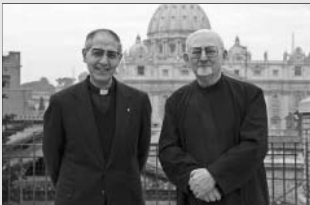
Il nuovo Preposito Generale dei Gesuiti, Adolfo Nicolás S.I., insieme al suo predecessore, Peter Hans Kolvenbach S.I.