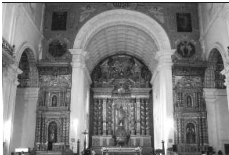
Interno della Basilica del Bom Jesús

essere aperta che con grande difficoltà, deve esser praticato un passaggio in modo che il corpo ne possa essere estratto facilmente. Quest'apertura dovrà essere controllata da tre chiavi, una in possesso del Provinciale, un'altra del Superiore della Casa Professa e la terza del Rettore del Collegio di St. Paul. Inoltre si dovrà avere sempre in casa una leggera cassa di legno per mettervi il santo corpo nel caso in cui si rendesse necessario un veloce trasferimento in luogo sicuro». E la convinzione crescente dell'importanza di custodire il corpo del santo continuò ad esercitare un certo fascino tra i gesuiti. Quando nel 1759 le autorità civili portoghesi li espulsero da Goa, si cominciò a dire che i gesuiti avevano portato con loro in Portogallo il corpo del santo. Queste voci divennero così insistenti che le autorità civili e quelle ecclesiastiche giudicarono necessario autorizzare una "esposizione" pubblica del corpo, cosa che avvenne nel febbraio nel 1782. Questa fu la più celebre delle prime esposizioni: scopo primario era fermare la