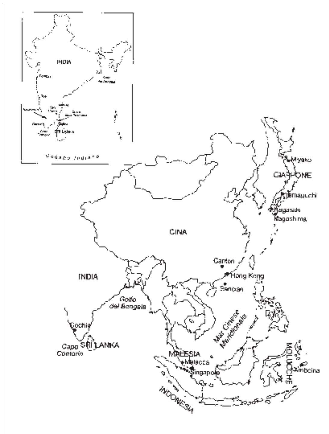
I viaggi di San Francesco Saverio