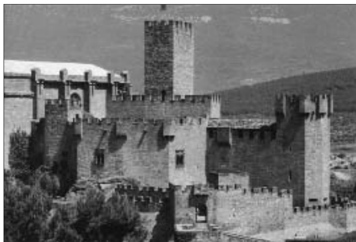
Castello di Xavier ( Navarra, Spagna )

togallo e del Papa Paolo III per estendersi nei territori scoperti dai Portoghesi e chiamati Indie Orientali. Non potendo imbarcarsi i due compagni Bobadilla e Rodriguez, Ignazio designa Francesco. Questi parte da Lisbona il 7 aprile 1541, come nunzio di Paolo III, consapevole di non rivedere più l'Europa.