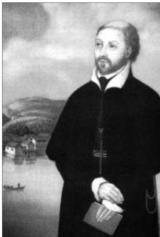
San Francesco Saverio nei pressi della città di Hirao, in Giappone ( opera di Y. Kobayakawa )

dell'università è più forte che mai, ed è una delle ragioni principali per cui attiriamo alcuni tra i più brillanti studenti del Giappone.