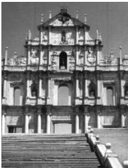
I resti della chiesa di St. Paul a Macao

Chieti, per saggiare la possibilità di aprirvi un collegio. Ritornò a Roma per proseguire i suoi studi e poco dopo divenne per un anno rettore del collegio gesuita di Macerata. Un anno dopo, nel 1573, Eduardo Mercuriano (1514-80) fu eletto generale. Egli decise di inviare Valignano come suo delegato personale o “visitatore” nelle missioni che la Compagnia aveva nelle Indie orientali e che a quel tempo abbracciavano una vasta zona geografica, che andava dal Mozambico all’India e più ad oriente alla Cina e al Giappone. Si può considerare questa decisione come una delle più importanti che Mercuriano prese durante il suo generalato.