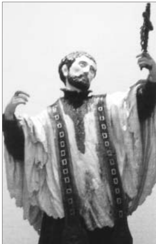
Scultura di San Francesco Saverio realizzata da un artista indiano (Basilica del Bom Jesús)