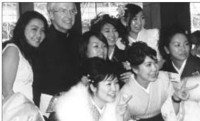
Studentesse dell'Università Sophia insieme a P. Currie

In misura assai più ridotta, l'arrivo di Saverio in Giappone fu un evento di enorme importanza per la Sophia University, l'università della Compagnia, a Tokio. Senza Saverio, Sophia non sarebbe come oggi la conosciamo. Impressionato dall'alto livello della cultura giapponese, Saverio volle che la Compagnia fondasse una università nella capitale del paese. I tentativi della Compagnia nell'ambito educativo, che fecero seguito al soggiorno di Saverio in Giappone, furono i prodromi e l'ispirazione per Sophia, che aprì le sue porte per la prima volta nel 1913.