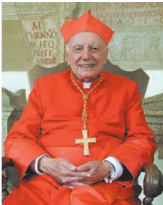
S. Em. Rev.ma Card. Thomás Špidlík

Oggi, infatti, in un mondo in cui il dialogo profondo con Dio e tra gli uomini è sempre più raro, sta tornando di attualità la figura del padre spirituale, che non è solo il confessore, ma un punto di riferimento fondamentale della nostra crescita umana e spirituale. È la Cura Personalis di cui parla Ignazio, il vero urgente ed universale.